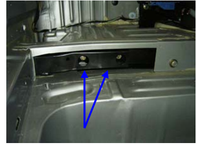
Montagepunkt innen links