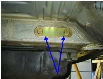
Montagepunkt außen lin