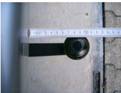
Fahrzeug von oben mit Kugelkopf Abstand