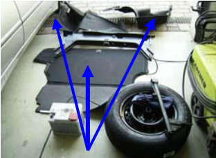
Verkleidung li./re. Bodenabdeckung