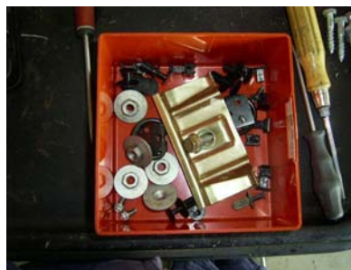
bei Demontage ange- fallenes Befestigungsmaterial