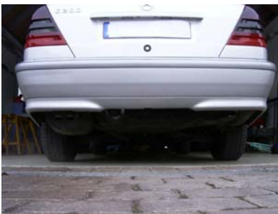
Fahrzeug von hinten vor dem Einbau