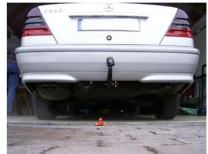
Fahrzeug von hinten mit Kugelkopf