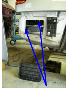
Montagepunkt rechts durch die Entlüftungsöffnung