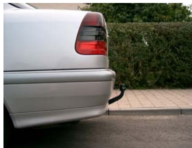
Fahrzeug von der Seite mit Kugelkopf