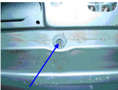
Befestigung Stoßfänger innen mitte