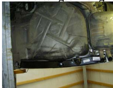
AHK von unten montiert