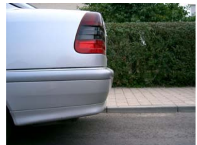
Fahrzeug von der Seite ohne Kugelkopf