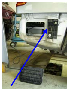
Befestigung außen, des Stoßfängers der Schiebeplatte