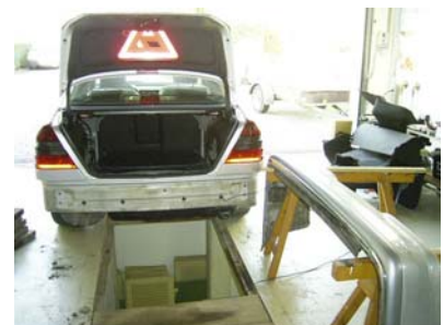
Fahrzeug ohne Stoßfänger