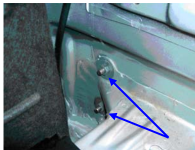
Befestigung Stoßfänger innen, rechts